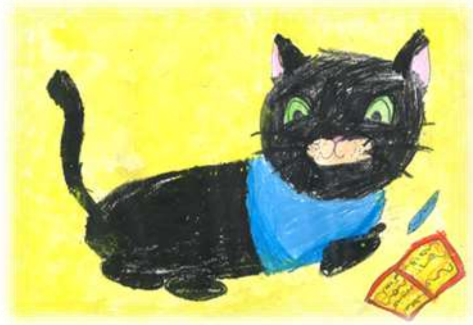
Ula Ajd, 1. a